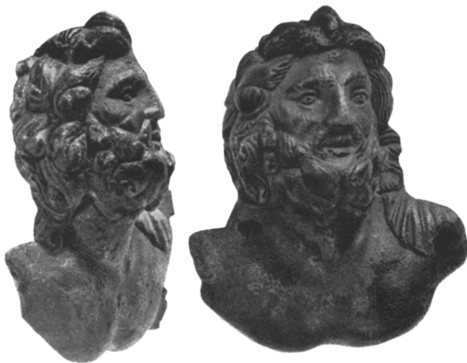
Fig. 3. Popești . Figurină elenistică de bronz aparținînd extremității inferioare a unei torți de vas metalic. Sec. II-I î.e.n. Profil și față (mărite la dublu).

stratigrafia tranșei Ya din 1954, prin răzuiri noi pe pereții de N și de S, pentru studierea depunerilor din prima epocă a fierului. În același scop s-a săpat pînă la pămîntul viu, la nivelul de 1,80 m, spațiul dintre Yb din 1954 și marea tranșee transversală trasă de D. V. Rosetti în anii 1931-1947. Acest spațiu, Yd , a fost săpat