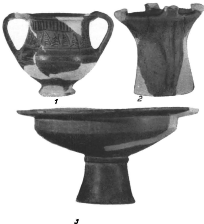
Fig. 1. Popești . Vase aparținând celor trei categorii ale ceramicii getice: 1, ceașcă cenușie de tehnică superioară ornată cu unghiuri lustruite; 2, sfesnic primitiv din pastă poroasă; 3, fructieră mare, cafenie lucioasă, lucrată cu mina. Reduceri: 1–2, la \frac{1}{4} ; 3, la \frac{1}{3} .

din a doua epocă a fierului, de toate categoriile, precum și fragmente de amfore elenistice. Printre aceste resturi ceramice sînt de notat cioburile unui mare recipient primitiv poros ornate cu briuri și cu proeminente, precum și o oală mai mică, întregă, de aceeași tehnică și cu același decor. De asemenea, remarcăm cioburile unei străchini cenușii mate, decorată pe marginea sa lată cu un vrej spiral incis, completându-se cu fragmente descoperite în campaniile anterioare în aceeași porțiune 1 . În aceeași